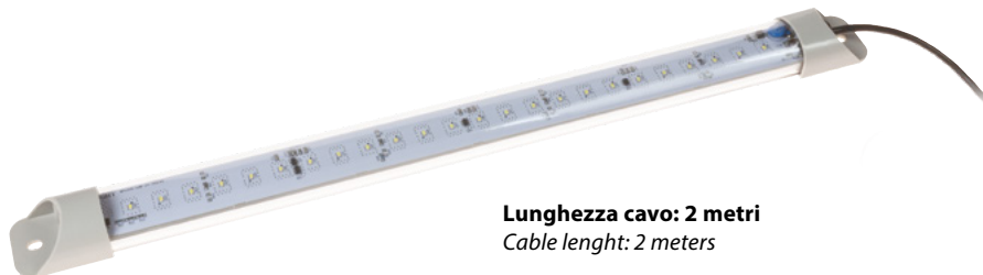
Lunghezza cavo: 2 metri Cable length: 2 meters

For minimum quantity order are available high-intensity versions and opal lens versions.